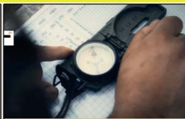
الطبوغرافيا (مقياس الرسم)

العقيدة القتالية لمقاتل السرايا (الإيثار)