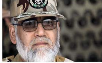
قائد القوة البرية في الجيش الإيراني العميد أحمد رضا بورديستان

الأرض وفي المباني بين صفوف المدنيين. في حين تستخدم المباني العامة كنقاط مراقبة ولا يسمح لقوات الأمم المتحدة المؤقتة في لبنان (اليونيفيل) بالدخول إلى الأماكن الخاصة. مما يجعل من الصعب على قوات (اليونيفيل) رصد عمليات تهريب السلاح.