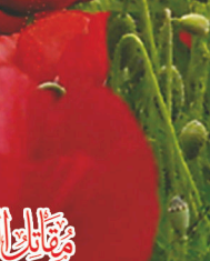
الشهيد فادي ماضي رفح - ٢٠١٤/٨/٤