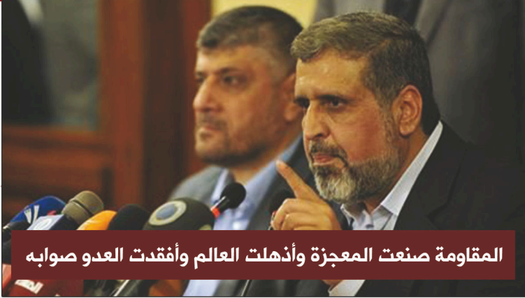
المقاومة صنعت المعجزة وأذهلت العالم وأفقدت العدو صوابه

وما فعلته المقاومة في غزة يجب أن يتم تصديره إلى الضفة الغربية في أسرع وقت ممكن" وقال "يجب أن يطمئن الجميع أن سلاح المقاومة وقدراتها العسكرية نقطة لم نسمح ان تكون على طاولة المفاوضات". وتابع قائلاً: "كل من يشك للحظة بانتصار المقاومة فلينظر إلى الكيان ماذا يقول، وإلى الإعلام العبري وتصريحات القيادات الصهيونية"، مستدل على انتصار المقاومة بانخفاض شعبية رئيس الوزراء الصهيوني بنيامين نتنياهو وفقاً لاستطلاع رأي صهيوني. وأضاف: "العدو جاء يختبرنا بما لا نختبر به ديننا وعقيدتنا وشهامتنا وكرامتنا أيها الكيان الغبي لا تعرف من هو الشعب الفلسطيني". وقال "يجب ان ننتبه إلى سلوك العدو ونراقبه بحذر شديد لأن التجارب السابقة تجعلنا حذرين لأن "إسرائيل" لا تقيم اعتباراً لأحد" ووجه حديثه للصهاينة قائلاً "عليكم أن تخجلوا أنكم تعيشون في دولة ترسل أقوى طائراتها لتقتل الأطفال والنساء". وأشاد بانجازات المقاومة قائلاً "لكل قوى المقاومة أقول لقد صنعت المعجزة وأذهلت العالم وأفقدتم العدو صوابه.